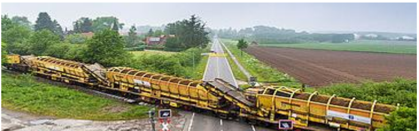
Streckensanierung der Bahnstrecke Lüneburg-Soltau

Während seiner Tätigkeit für die OHE leitete er zeitweise auch regionale Hafengesellschaften, die teilweise mit der OHE verbunden waren. Diese Doppelfunktionen lebten auch während seiner Hildesheimer Zeit fort. Es handelte sich um die Häfen in Lüneburg, Uelzen und Wittingen.